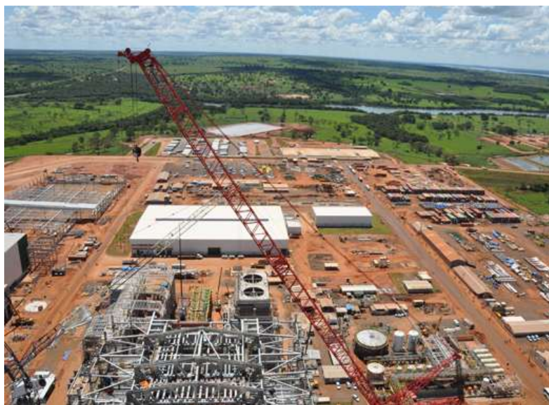
Obras de construção da fábrica de celulose do Grupo Eldorado

A AFITEMAQ instalou uma Base Avançada para atender a demanda desta obra e parabeniza a equipe de vendas por mais um projeto que estamos atendendo.